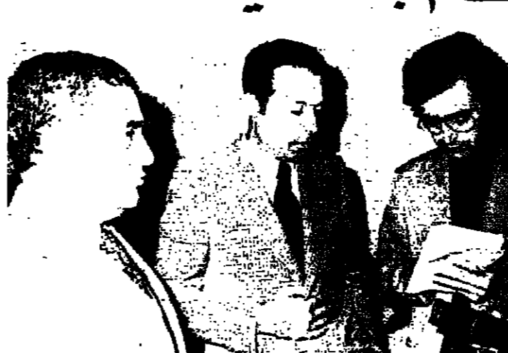
السيد نفيي لحود يتحدث الى الصحافيين، والى جانبه السيد والمص

بعد اجتماع حضره روفائيل وعطالله ومحرم، يبحث مع الجارودي تفاصيل مساعدات صندوق الانماء العربي للبيروت. اسيايا تعرض الاسهام بتنشيط الاقتصاد اللبناني.